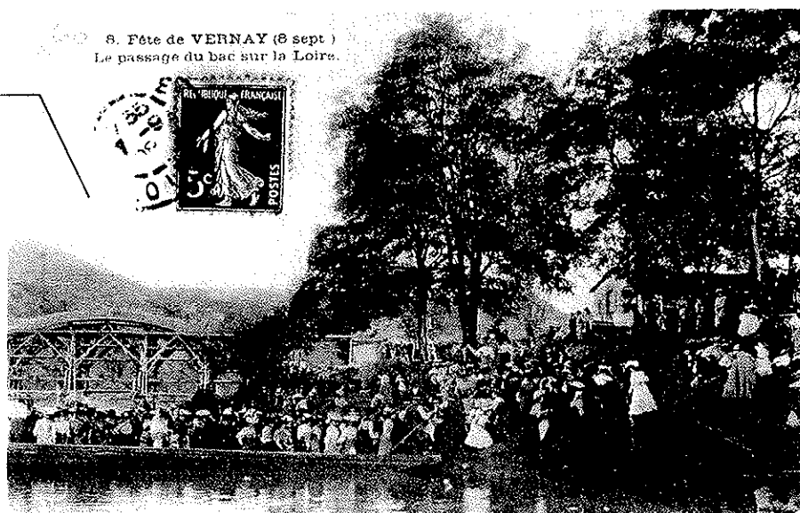
8. Fête de VERNAY (8 sept) Le passage du bac sur la Loire.