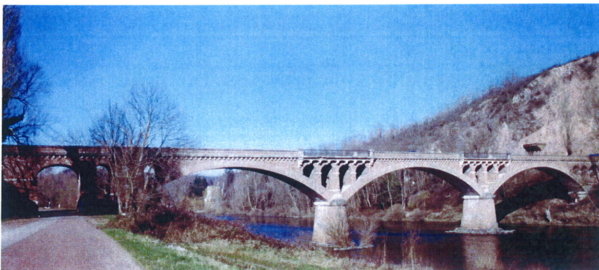
Le pont de Vernay de nos jours

Le pont fonctionnant depuis 10 mois et offrant plus de sécurité et de facilités, la suppression du bac fut décidée le 30 juin 1907.